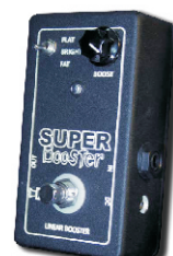
SUPER BOOSTER LINEAR BOOSTER