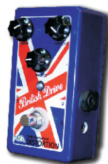
BRITISH DRIVE TUBE EMULATION DISTORTION