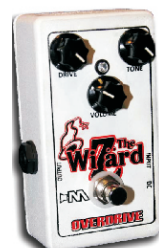
THE WIZARD OVERDRIVE