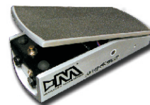
BLACK SHEEP WAH WAH