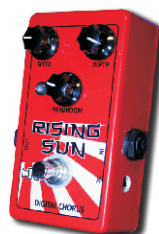
RISING SUN DIGITAL CHORUS / MODULATED DELAY